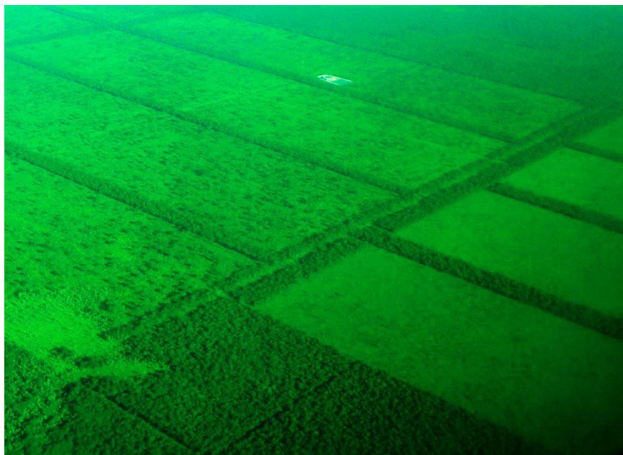
Fig. 2. Imagen aérea de una finca ganadera basada en la apertura de bosques (en verde oscuro) e implantación de pasturas (en verde claro) para el desarrollo de ganadería extensiva.