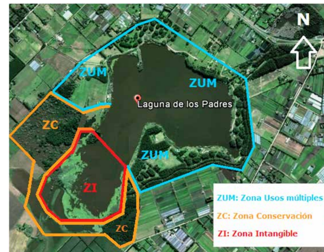
Figura 2: Recorrido del Sendero Munay- Koi- Elaboración propia

https://www.google.com.ar/maps/place/Laguna+de+los+Padres/@-37.9410556,-57.7526107,4530m/data=!3m1!1e3!4m5!3m4!1s0x958528d47cdd0aa7:0xe96eb3164005e737!8m2!3d-37.9368964!4d-57.7374471