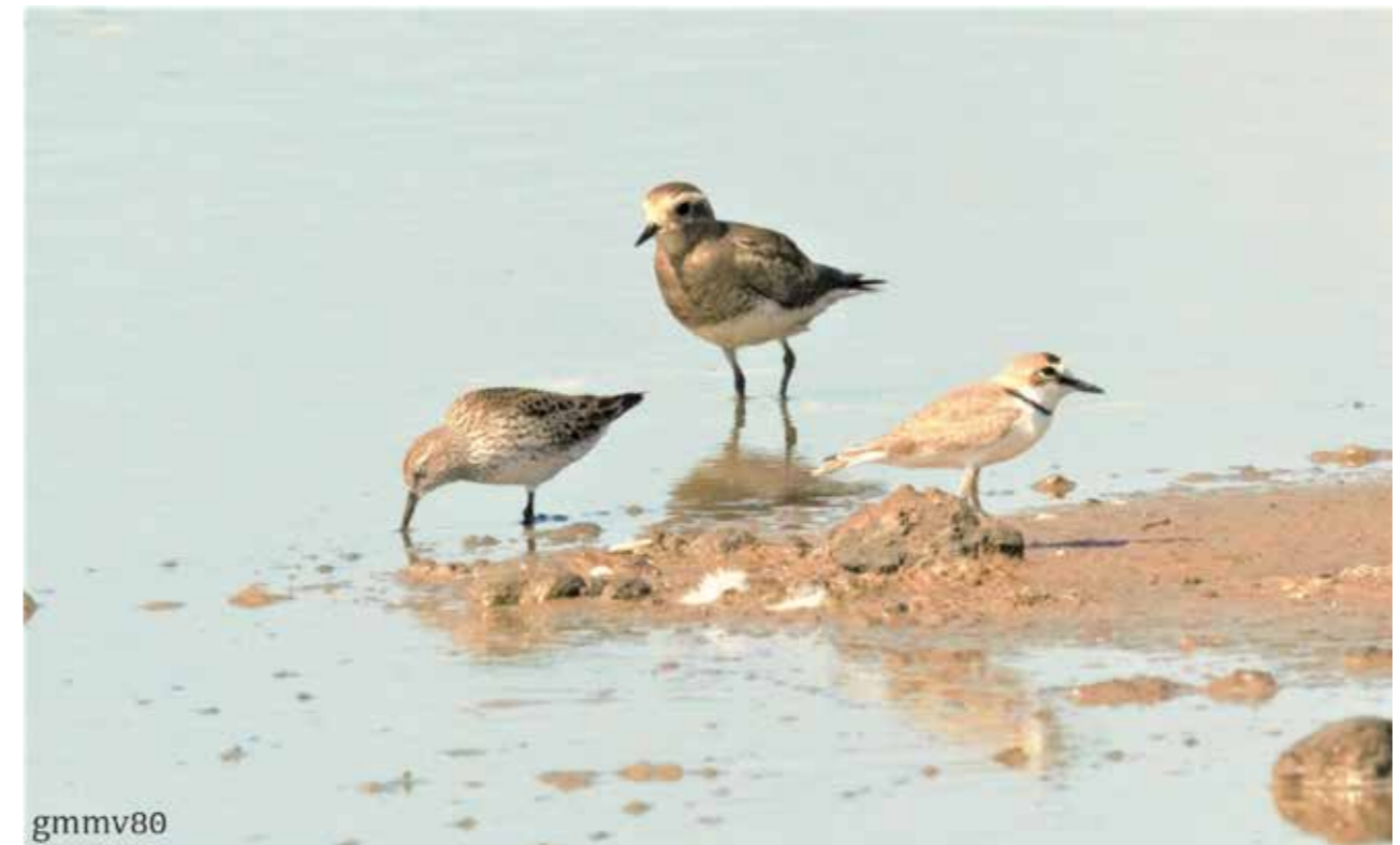
Figura 1. Individuo de Chorlo pecho canela ( Charadrius modestus , centro), junto con Playerito rabadilla blanca ( Calidris fuscicollis , izquierda) y Chorlito de collar ( Charadrius collaris , derecha).

El registro se da luego de 14 años desde la última documentación de la especie para Paraguay y se sitúa a 144 km en dirección noreste del primer registro documentado (Fig. 3); siendo así, el segundo registro documentado para el Chaco paraguayo. Esta localidad forma parte del sistema de lagunas saladas del Riacho Yacaré, las cuales conforman una de las 57 Áreas Importantes para la Conservación de las Aves (IBA por sus siglas en inglés, PY010). Este sitio fue calificado como IBA bajo los criterios A1, A3, A4i, A4iii; los cuales hacen referencia a las especies migratorias amenazadas a nivel internacional registradas en el área, a las especies restringidas a un bioma y por albergar una gran concentración de aves acuáticas y aves playeras en épocas de migración (BirdLife International 2007, Guyra Paraguay 2008). A pesar de ello, este sitio no se encuentra bajo el sistema de áreas silvestres protegidas a nivel nacional.