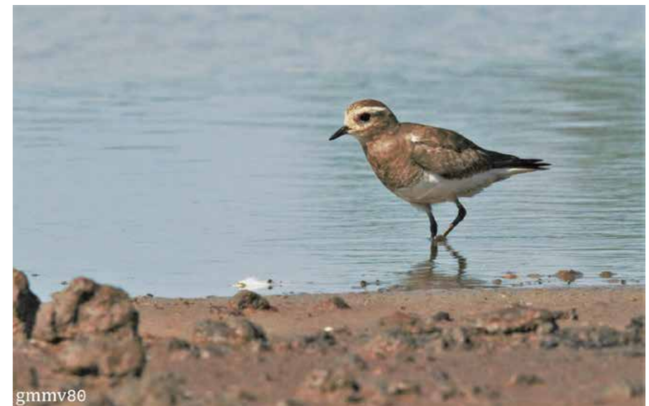
Figura 2. Individuo de Chorlo pecho canela ( Charadrius modestus ).